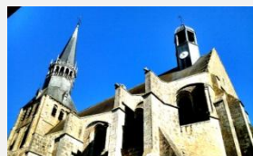
47m de long - 20m de large 65m de haut

Sous le règne de Louis XIV, les fortifications ne furent plus entretenues avec soin. Ainsi les éléments de l'enceinte de Bonneval se sont détériorés et les deux terribles inondations de 1665 et 1711 laissèrent derrière elles de nombreux dégâts et ruines.