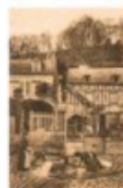
Rue des Lavandières

Les rues de Bernay portaient autrefois des noms évocateurs dont certains subsistent encore.