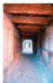
Passage de la Cohue

La Cohue était la salle de Justice de la juridiction d'Orbec. Les altercations causées lors des procès lui valurent ce nom.